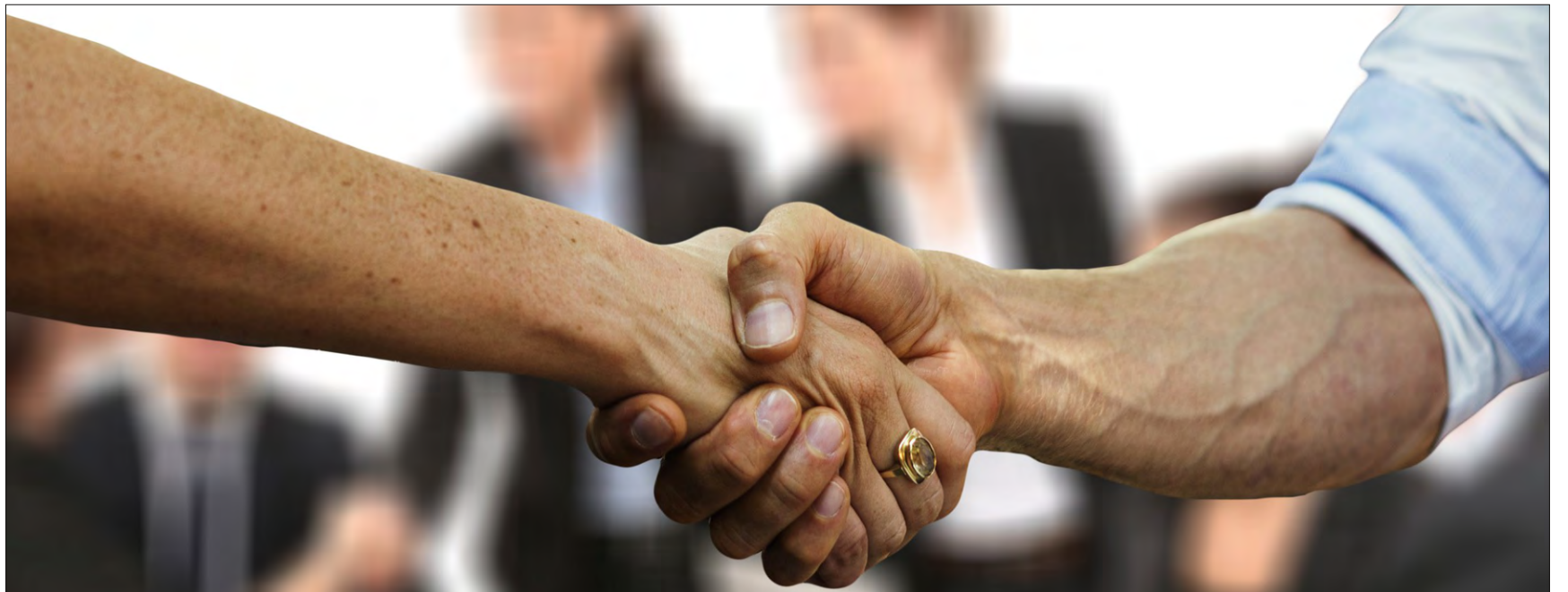
Politica – l'art dal pussaivel u dal cumpromiss.

Entant che bunamain tuts spetgan plain mirveglias ils emprims resultats da las elecziuns actualas, dat la Marella in sguard enavos. Dapi exact 120 onns datti il sistem ch'è anc oz en vigur, cun tschintg cussegliers guvernativs e tschintg departaments. Dapi il 1894 han 82 umens e duas dunnas guvernà il Grischun. La Marella va libramain pasculond tras ils 120 onns cun lur istorgias politicas e personalas. Ella raquinta da cunvegns, scumbigls ed intrigas. Ed a la